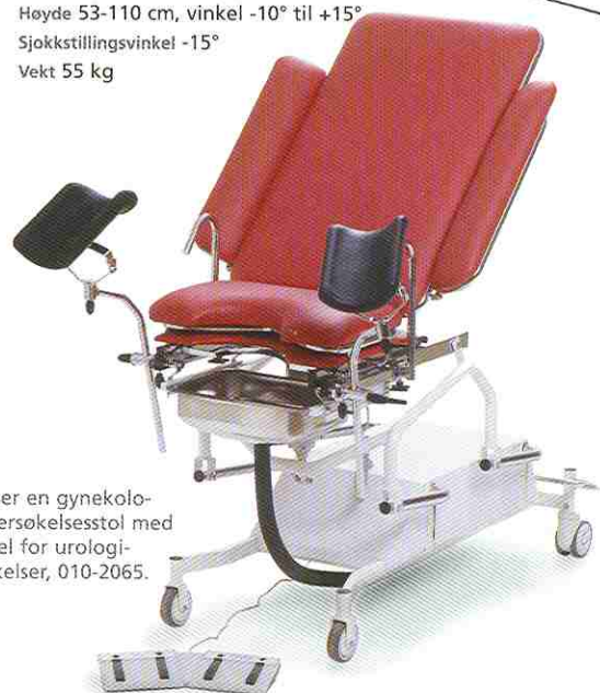
Bildet viser en gynekologisk undersøkelsesstol med tilleggsdel for urologiundersøkelser, 010-2065.

Vi forbeholder oss retten til konstruksjonsendringer