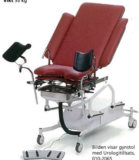
Bilden visar gynstol med Urologitillsats, 010-2065