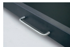
Integrerat handtag ingår