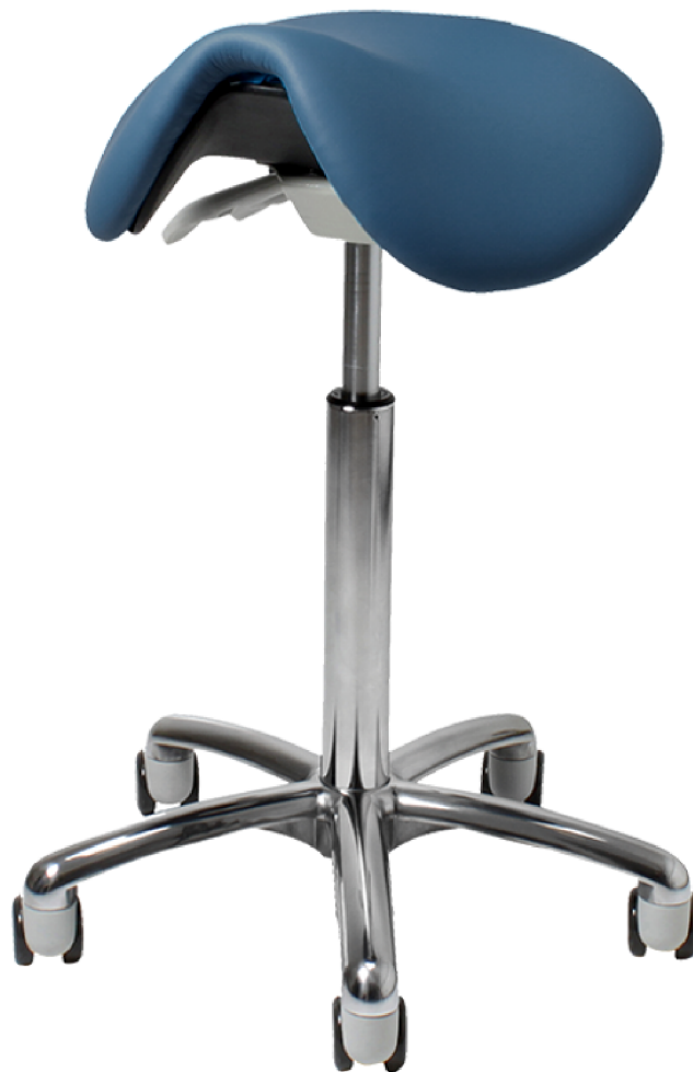
Samba 420, sadelstolen utan ryggstöd. Med standardsäte 43x35 cm