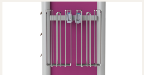
Double supports sacs à déchets Réf. 1501.19

We reserve the right to make changes without notice regarding the products presented in this catalogue.