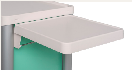
Tablette latérale rabattable Réf. 1500.01