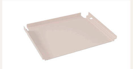
Plateau COMPACT Réf. 1500.43