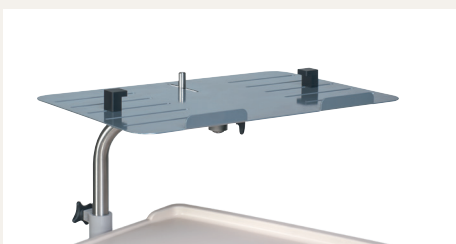
Plateau informatique sécurisé Réf. 1500.81