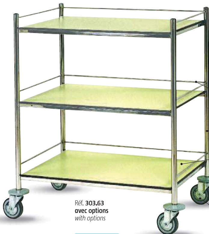
Réf. 303.63 avec options with options