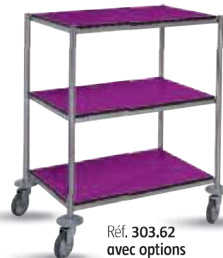
Réf. 303.62 avec options with options