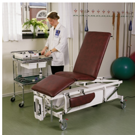
Fysio II elektrisk, nr 010-3001 och 010-0008 låsbara hjul, sats.