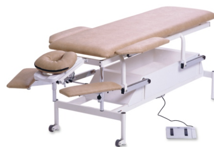
Fysio I elektrisk, nr 010-2000 med hjulpar.