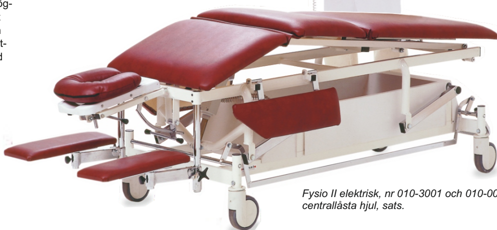
Fysio II elektrisk, nr 010-3001 och 010-0007 centrallåsta hjul, sats.

Ben-/ryggsektion, 80 cm. Mellandel, 39 cm. Främre del, 42 cm. Huvudstöd, 34 cm.