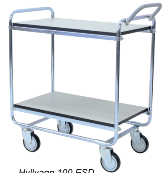
Hyllvagn 100 ESD