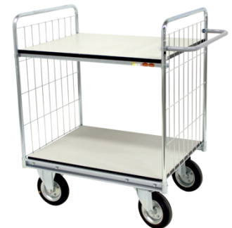
Hyllvagn 300/24 ESD