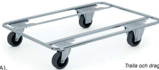
Tralla och dragstång

Passar utmärkt för hantering av tyngre gods i t ex plastbackar eller på halvfall.