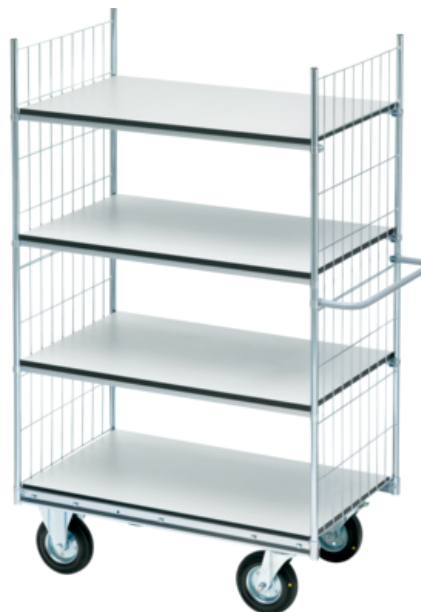
Hyllvagn 300/22 ESD